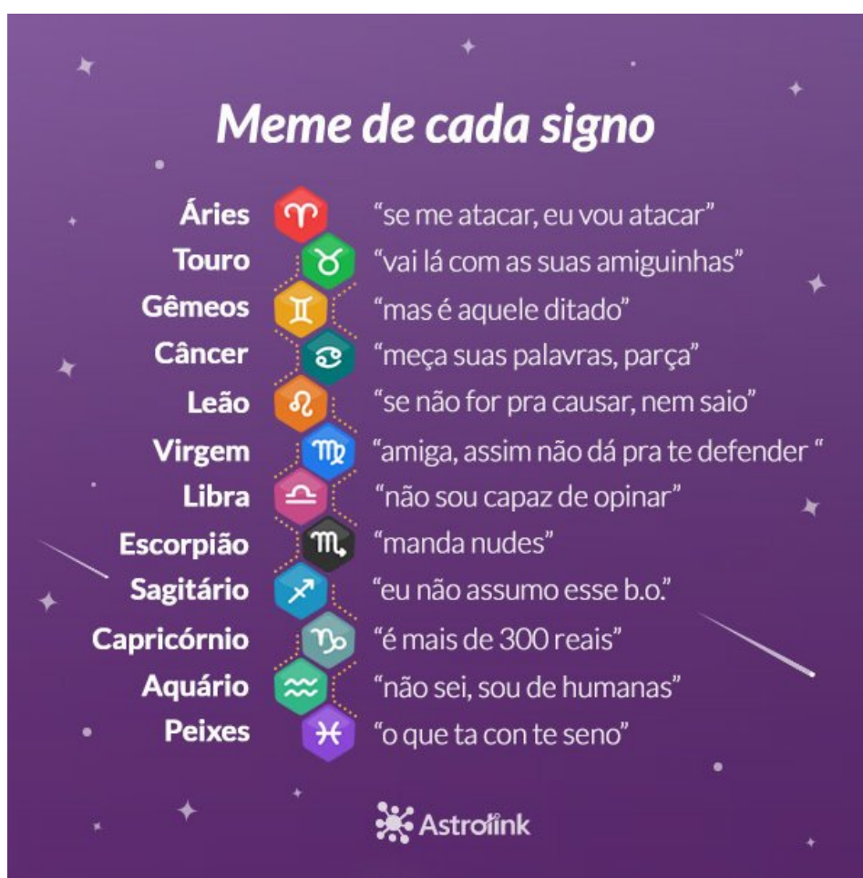
Imagem 3: Meme de cada signo com frases virais da Internet

A busca pelo autoconhecimento por meio da Astrologia muitas vezes se dá a partir de um outro fenômeno das Internet: o meme 35 . Conforme informações do site Personare , metade dos acessos corresponde a usuários que já possuem uma base sobre o assunto e querem aprimorar seus conhecimentos e a outra metade é de curiosos que chegam ao portal depois de ter visto algum meme engraçado sobre o próprio signo em alguma rede social.