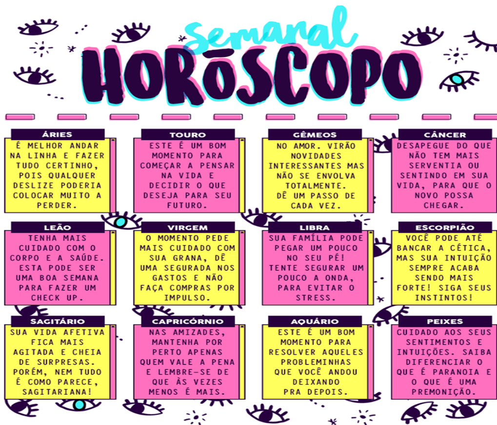
Imagem 2: Horóscopo publicado na revista Capricho em junho de 2017

Cordeiro analisou o discurso da revista Capricho , voltada para jovens com idades entre 12 a 27 anos, e segundo ela, é “no horóscopo propriamente dito, num plano imagético, observamos a figura de uma jovem com um estilo próprio da idade” (CORDEIRO, 2017, p. 52). “Ao sugerir a “Moda Astral: A tiara que combina com seu signo”, traz em cada signo a imagem desse adereço feminino característico da vestimenta das leitoras” (CORDEIRO, 2017, p.52).